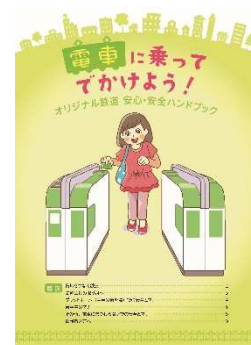
ハンドブックイメージ