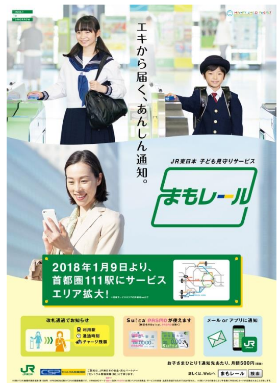
「まもレール」イメージポスター

本件プレスリリースは、ときわクラブ、丸の内記者クラブ、JR記者クラブ、国土交通記者会、レジャー記者クラブへお届けしています。